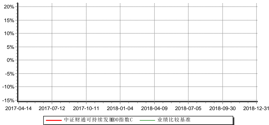
中证财通中国可持续发展100(ECPI ESG)指数增强型证券投资基金C 累计净值增长率与业绩比较基准收益率历史走势对比图 (2017年04月14日-2018年12月31日)

注: (1)本基金合同生效日为2013年3月22日; 自2017年4月14日起本基金增设收取销售服务费的C类份额; 报告期内未有C类份额申购数据, 报告期内单位净值为1.0000元。 (2)本基金投资于中证财通中国可持续发展100 (ECPI ESG) 指数成份股和备选成份股的资产占基金资产: \geq 80\% ; 投资于权证的资产占基金资产净值: \leq 3\% ; 现金或者到期日在一年以内的政府债券占基金资产净值: \geq 5\% 。本基金的建仓期为2013年3月22日至2013年9月22日;